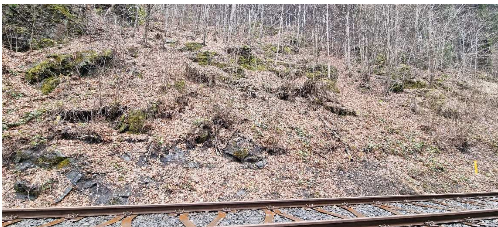
odstranění vzrostlé vegetace, obnova akumulčního prostoru