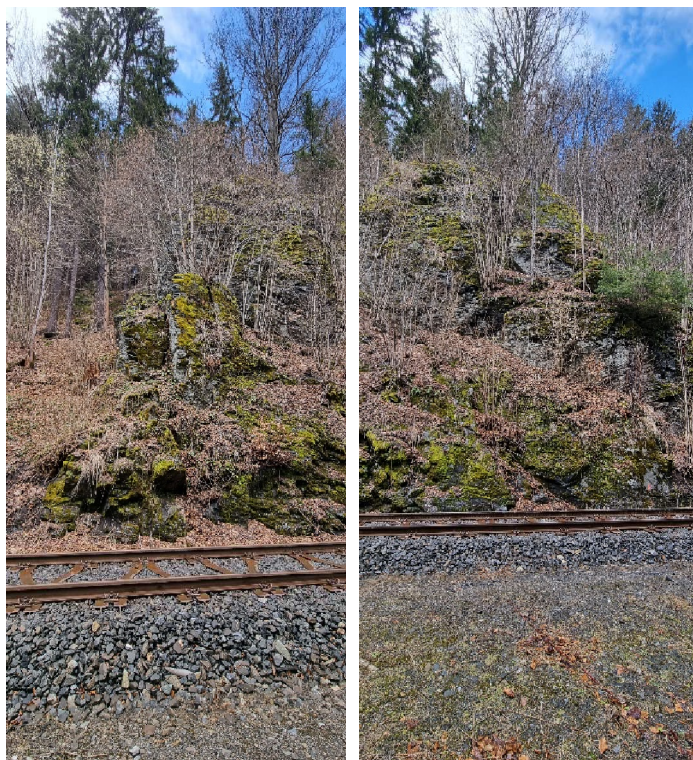
očištění skalného svahu, odstranění potenciálně nestabilního bloku, injektáž puklin, obnova akumulčního prostoru